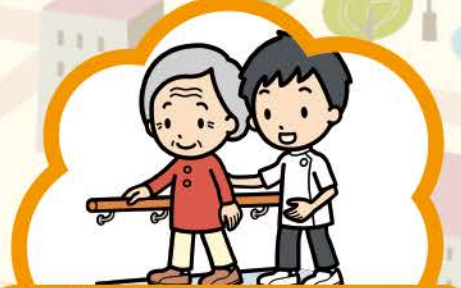
通所リハビリテーション (デイケア)

利用者の居宅を訪問し、 食事・排せつ・入浴などの 介護や日常生活の支援を行います。