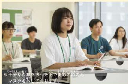
※十分な距離を取った上で撮影の時のみ、マスクを外しております。