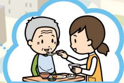
特別養護老人ホーム