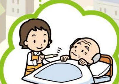
ホームヘルプ (訪問介護)

共同生活を営む住居で認知症の方へ、 入浴などの介護や日常生活上の支援 などを行います。