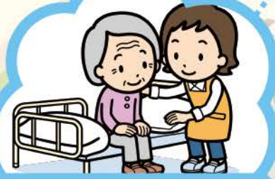
介護老人保健施設

身体・健康状態が安定している方に、 住宅復帰に向けたリハビリテーショ ンを中心とした介護を行います。