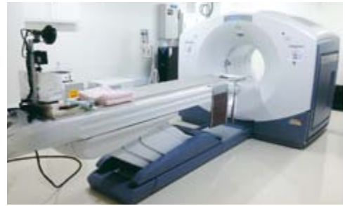
GE Discovery PET/CT710 Q.Suite Vision