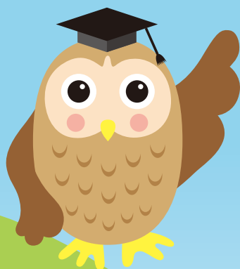
エゾフクロウ先生

コクちゃん、かぜが治って良かったね。 ところでコクちゃんとホーくん。 コクちゃんのかぜを治すのに、全部で いくらくらいかかったかわかるかい？