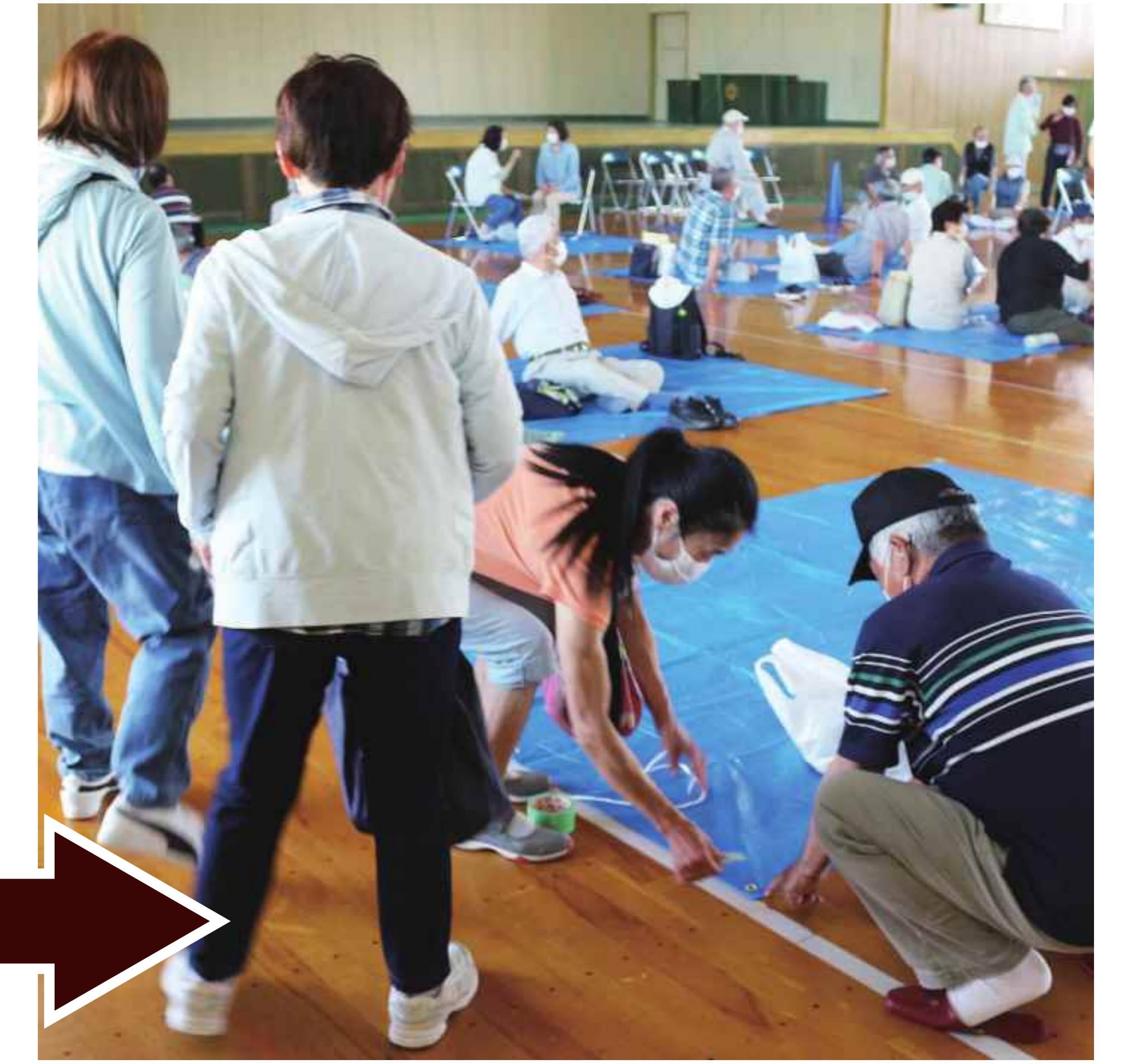
避難スペースを割り当て