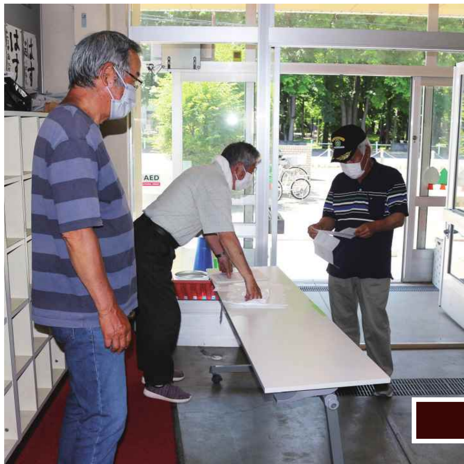
避難者を振り分けて案内