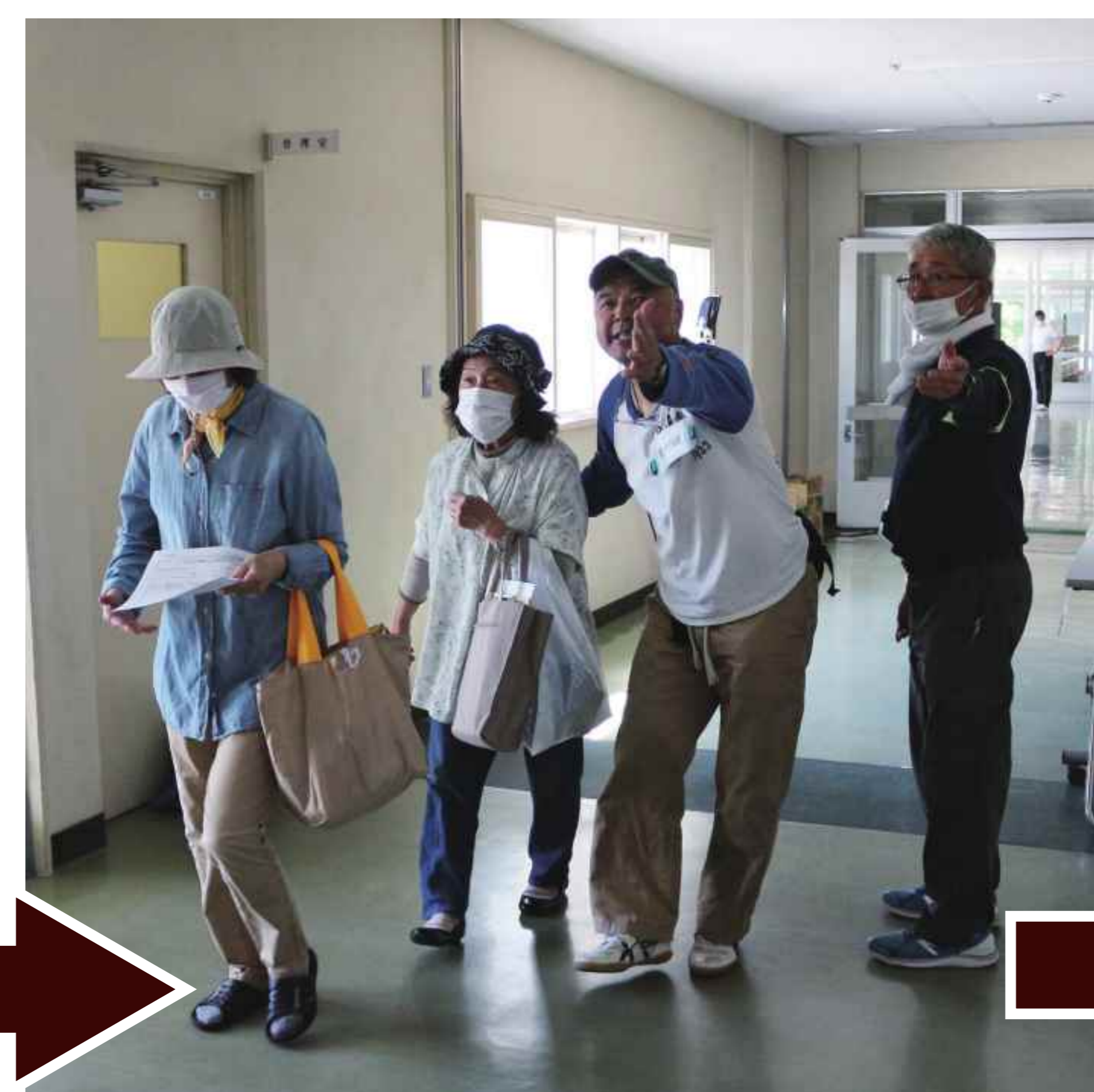
一般避難者は体育館に誘導