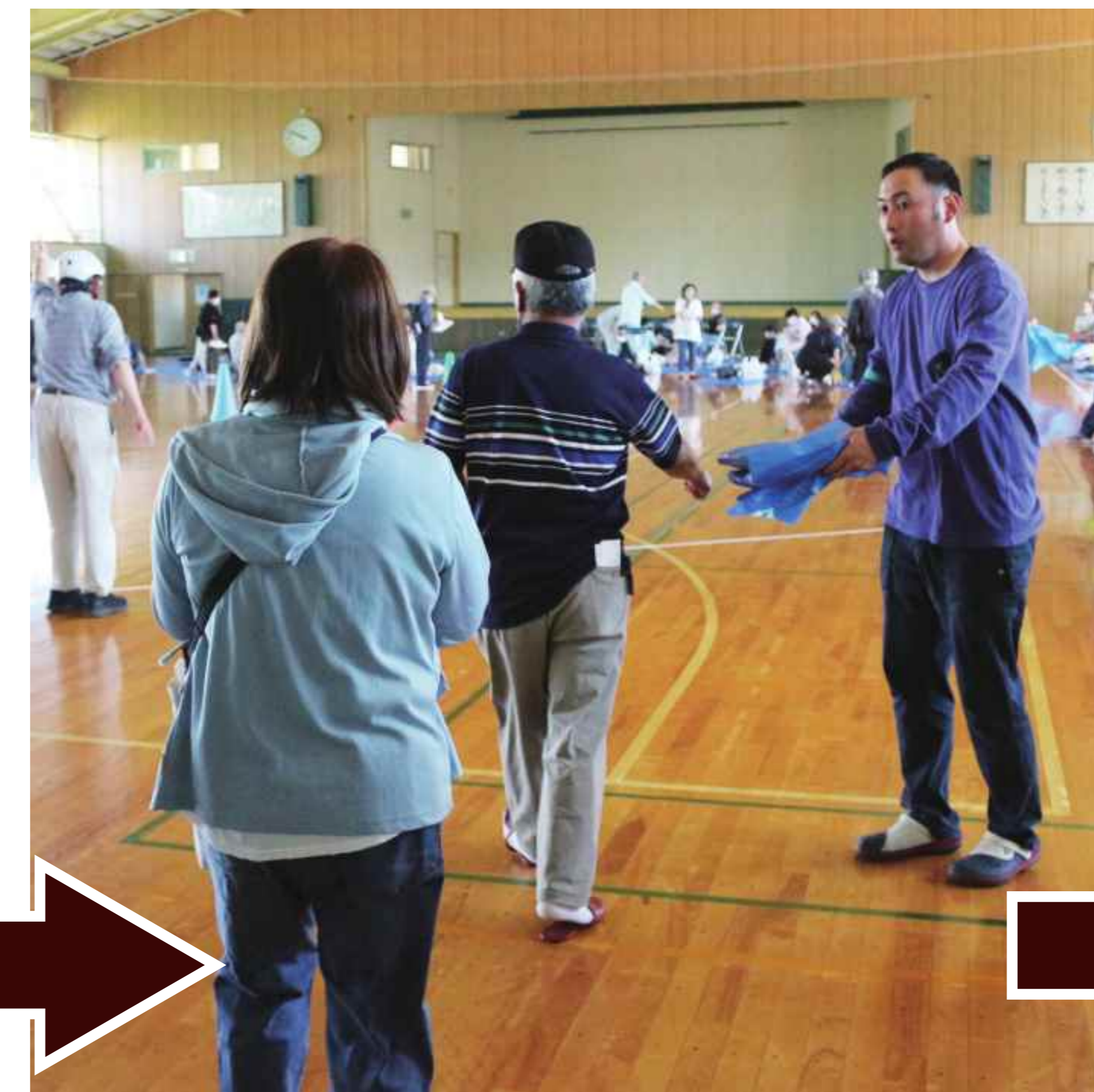
家族数に応じてシートを渡す