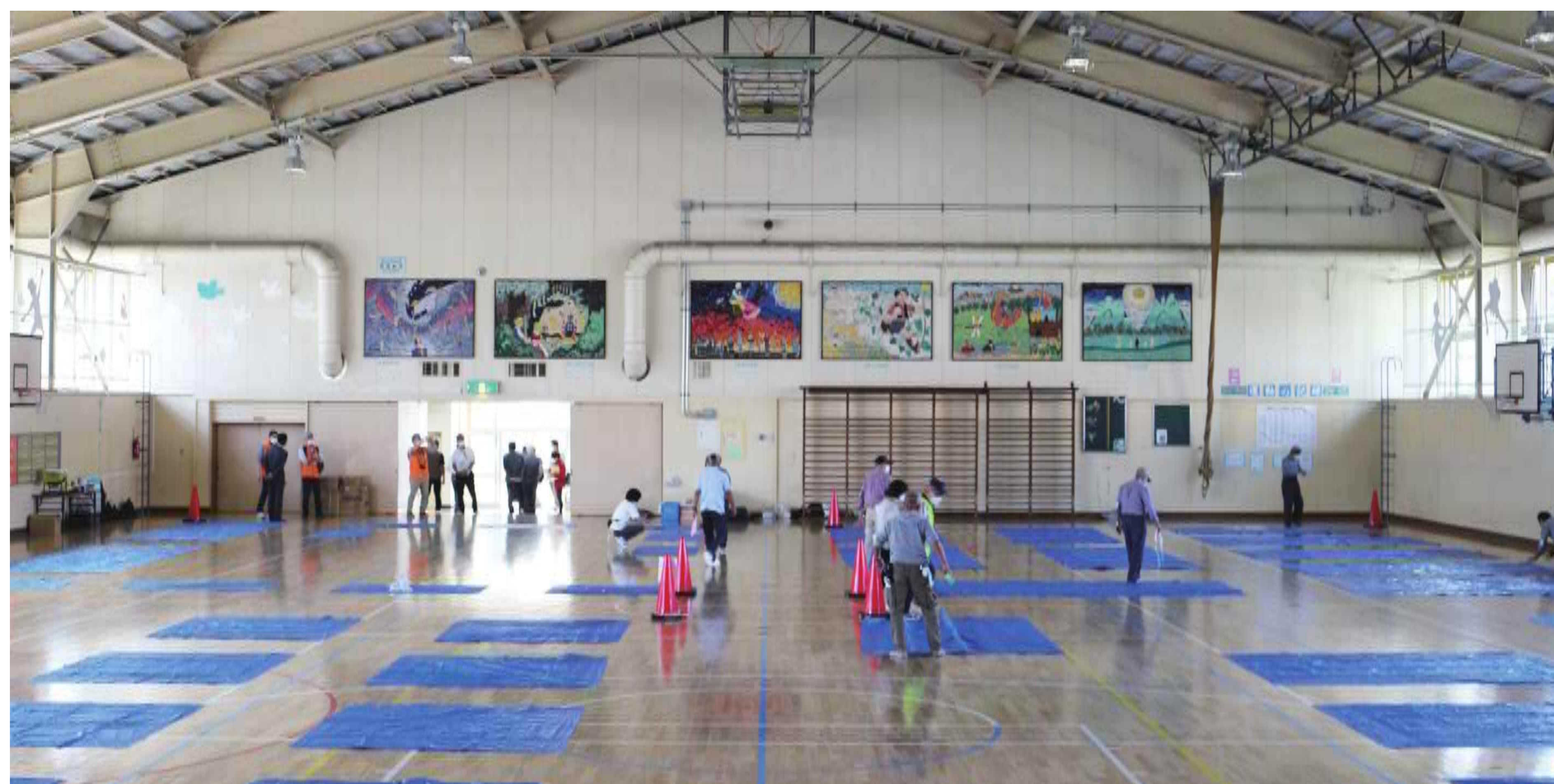
事前にスペースを区画して避難スペースを割り当てる方式で実施した栄町小の訓練

実践的な避難所運営訓練の積み重ねで、地域のノウハウを高めて、ベストな方法を見つけよう！