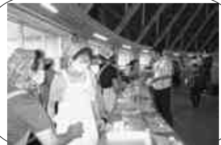
今年度はねんりんピックのお手伝いも させていただきました。