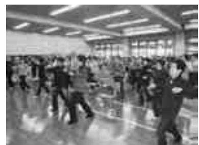
手足・腰・胸を十分に伸ばし 心地よい汗を流しました。