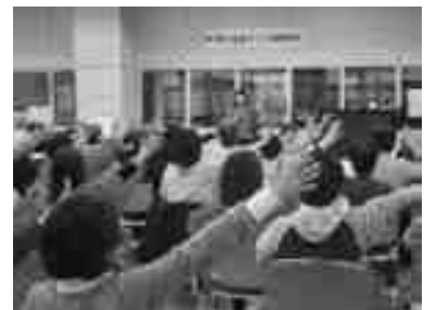
どもん先生による健美操