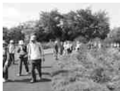
ウォーキング(百合ヶ原公園)