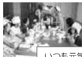
いつも元気な子どもたちです

札幌市食育推進計画にもとづき東区内7箇所のすこやか倶楽部で 高齢者食生活指針の説明とひとくちですが試食をしていただいたり、 子どもたちには実習を通して食事の大切さを伝え、また、地域の皆様 には料理教室を通して北海道型食生活をお勧めしています