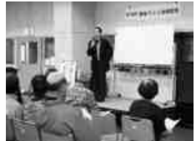
藤村先生による、 薬と認知症についての講話