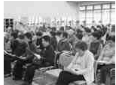
熱心にメモをとる人も・・・