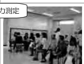
保健師による健康相談