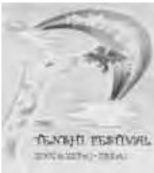
学祭用パンフレット

【健康診断コーナー】学生が実施する体力測定の結果について、保健師が個別に健康相談に応じました。