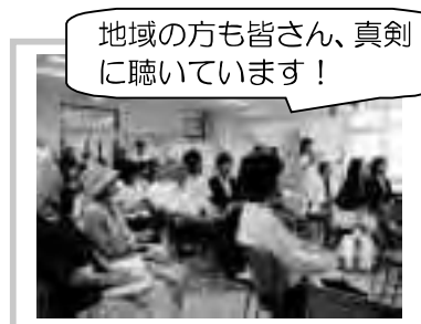
地域の方も皆さん、真剣に聴いています！