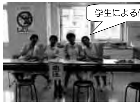
学生による体力測定