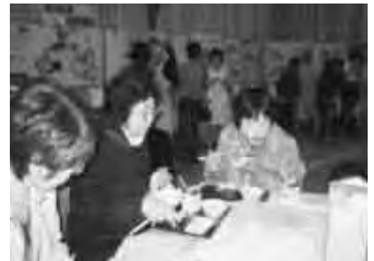
試食レシピもじっくり読みながら！！