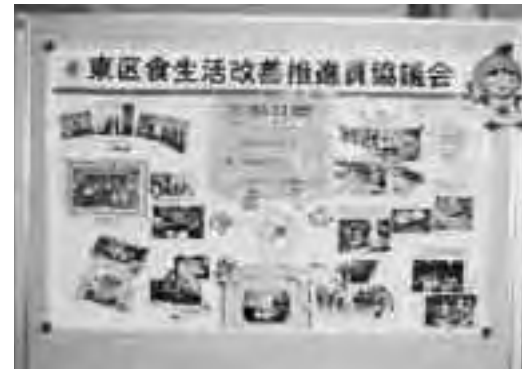
地区活動のご紹介パネルです

今後は地区を超えて 東区食改 全体の事業として取り組める方法を見つけて行きたいと考えております。