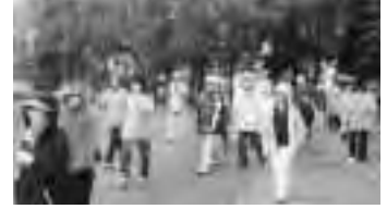
ウォーキングは、健康づくりの基本!伏古公園で…

目的:「東区ゆめプラン21」に基づき地域に「健康づくりの輪」を広める。 (平成15年11月～:健康づくりを実践している地域・自主活動グループの活動の推進、関係団体・機関との連携強化) 構成:公募及び行政から推薦された委員15名で設立 (平成15年11月～:平成9年に設置した懇話会の委員を中心とし、3師会代表、各地区健康づくり団体の代表者等にて構成) 活動:体制づくり、場所の設定と効率的活用、子どもたちの健康づくりの策定と報告