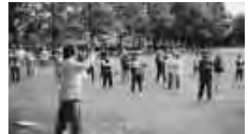
伏古公園での太極拳法。皆さん、様になっているよ!