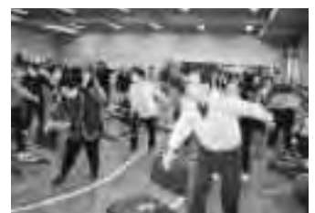
ダンベル体操で筋力モリモリ!力余って投げ飛ばさないでね…

目的:東区における区民の健康づくりの発展及び「健康さっぽろ21」の推進 構成:区内で健康づくりを実践しているグループ・団体の代表者等 活動:健康づくり活動の相互協力、情報収集・交換、区民への情報提供等