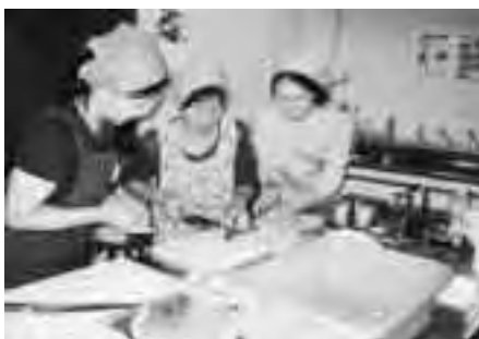
地域の皆様へ料理講習