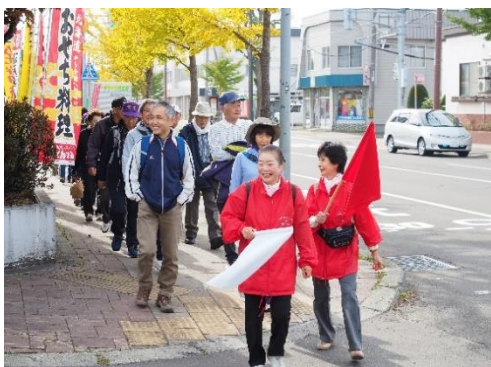
北光線を歩こうウォーキング