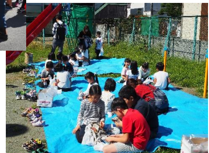
焼き芋パーティー～親子で楽しく