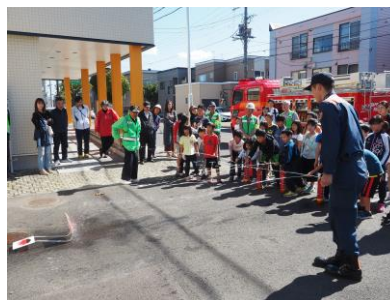
防災教室～防火訓練に 子どもたちは真剣！！