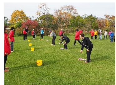
玉入れ～上手く入るかな