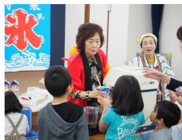
ミニ縁日～かき氷は人気 No1