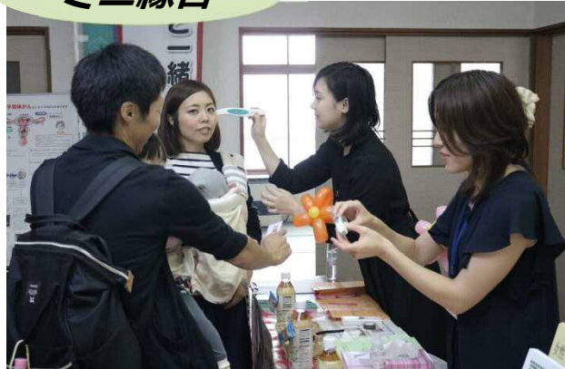
ミニ縁日 肌年齢ドキドキ！