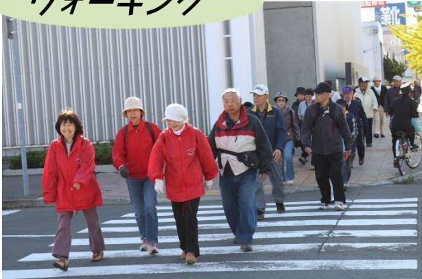
北光線を歩こうウォーキング