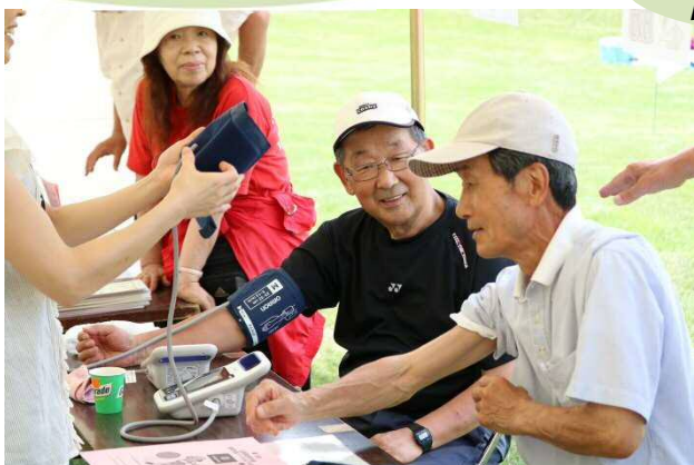
血圧測定で健康チェック