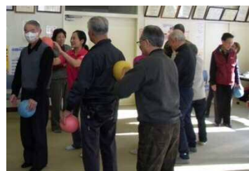
健康講座(2月) Gボール体操