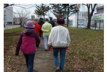
ウォーキング大会(4月)