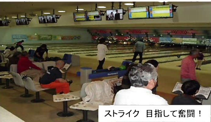
ストライク 目指して奮闘！

※日頃の運動不足を解消のため、一投入魂！熱戦競技後は表彰式を兼ね、懇親会で慰労しました。