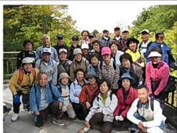
千歳川おはよう橋にて(10月5日)

10月5日、曇り、気温17度、会場を千歳市に移し「秋のウォーキング会」が開催された。午前9時、参加者32名を乗せてバスは千歳市へ向けて出発、10時30分に千歳市林東公園(駐車場、トイレ設備有り)に到着する。千歳川に沿って敷設された遊歩道を下流に向け、インディアン水車までの4.3kmを歩く行程である。準備体操を終え、出発してまもなく、景観に留意して建設された「おはよう橋」に立ち寄る。支笏湖を源とする千歳川の水は清く、悠々と流れるその様は美しい。橋の上で記念撮影(写真掲載)。さらに川に沿って進むと川幅は徐々に広がり流れも緩やかに、清流にしか生えない水草等を眺めながら、インディアン水車までの1時間半コースは飽きることはない。インディアン水車によるサケの捕獲は、残念ながら見ることはできなかったものの、築の廻りを泳ぐサケは散見できた。昼食は、隣接の「道の駅サーモンパーク千歳」でとったが、同駅で食べることができるピザやスープカレー、いくら丼等は大変美味しい。午後から水族館を見学、巨大水槽のサケには迫力がある。「千歳川の水中がそのまま水族館に」をキャッチフレーズにするだけあって、様々な淡水魚を観察することができた。帰りに千歳ワイナリーを見学、ハスカップワインを試飲し、ほろ酔い気分でバスにゆられながら帰路に着く。