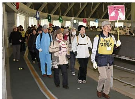
健康・スポーツまつり 2016