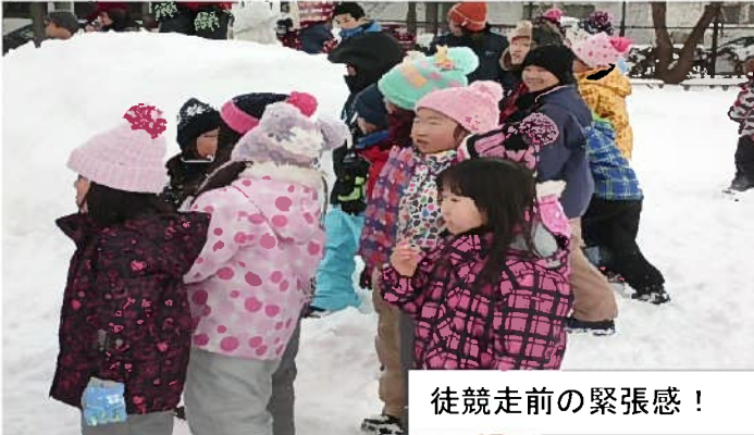
徒競走前の緊張感！

※鉄東の伝統ある冬の祭典 子供から大人まで参集し各種競技で汗をかき、運動不足を解消しました。