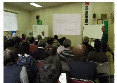
地域健康教室(医師会)