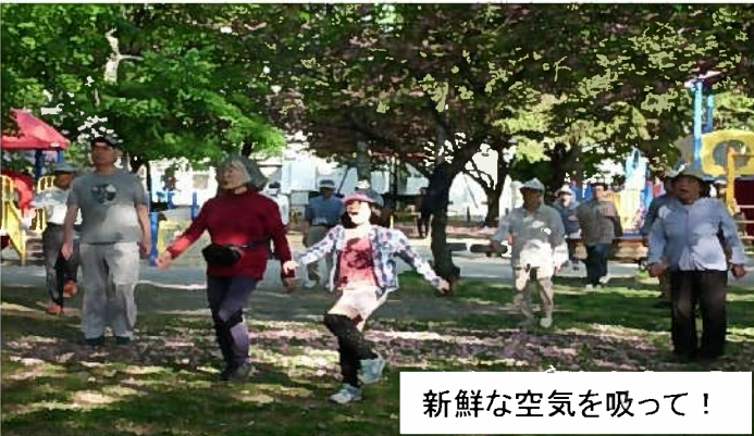
新鮮な空気を吸って！

※新緑の季節 夏休み中は子供が多数参加し、元気をもらいながら健康増進に努めました。