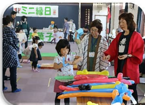
バルーン上手につくれるかな？