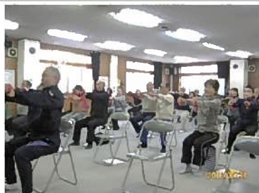
東苗穂福祉会館で健康体操(2月24日)