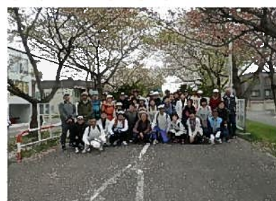
白石サイクリングロード桜並木を背景に(5月10日)