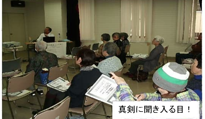
真剣に聞き入る目！

※医師の「肺炎！予防接種と対策」、社会福祉士の「元気に過ごすためのヒント！」の講話をいただきました。