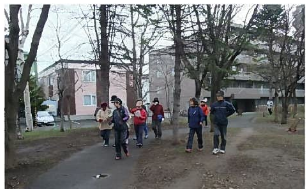
ウォーキング大会