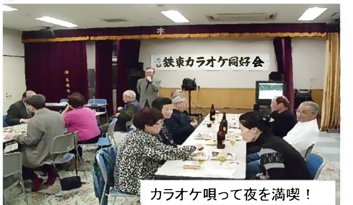
カラオケ唄って夜を満喫！

※30年の歴史ある同好会は約40名の会員が在籍し健康維持のため月1回 のど自慢で発散しています。