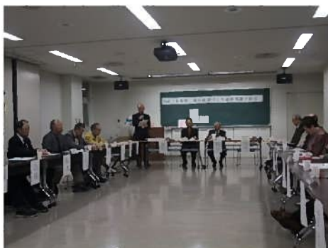
東区健康づくり連絡協議会 総会