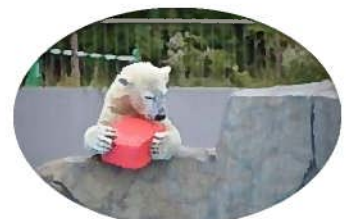
*円山動物園にて 白熊のリラ