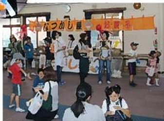
親子で楽しんでいます