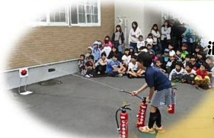
消火器むずかしい…