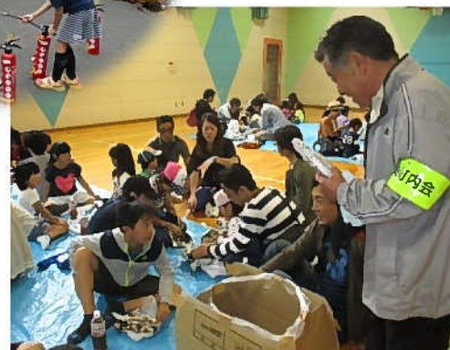
親子でパトロールに出発 その後おいしいやきいもを食べました