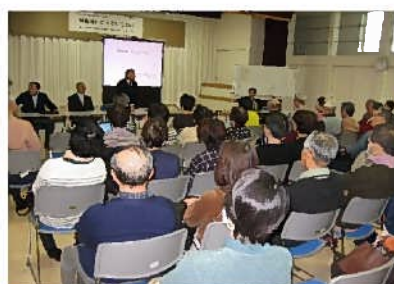
モエレ交流センターで講演会(11月19日)