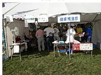
お祭り会場での体力測定会(8月6日)