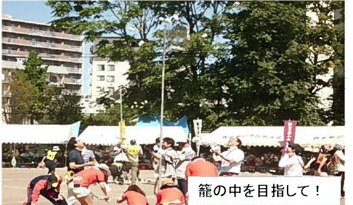
籠の中を目指して！

※16の分区対抗の伝統ある運動会は約900人が参加し、健康増進と連帯意識の高揚を図りました。