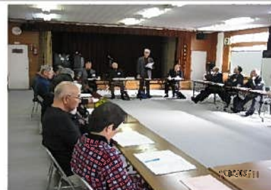
東苗穂福祉会館で体験発表会(3月11日)