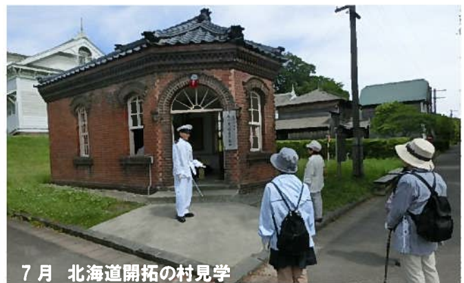
7月 北海道開拓の村見学