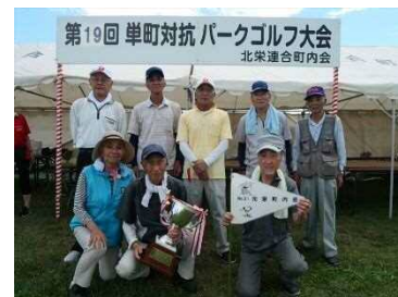
パークゴルフ大会