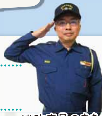
消防吏員のまちづくりセンター所長は市内で鉄東だけ！

地域を東西に貫く「ななめ通り」（道道花畔札幌線）。伏籠川沿いの獣道を人が道路として使うようになったのが始まりといわれています。古くから栄えた通りの周辺には、ノスタルジックな光景が広がっています。