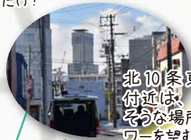
北10条東10丁目付近は、手の届きそうな場所にJRタワーを望むスポット！

←ななめ通りを行き来する人の目印になっていたといわれている、ヤチダモの木があります。