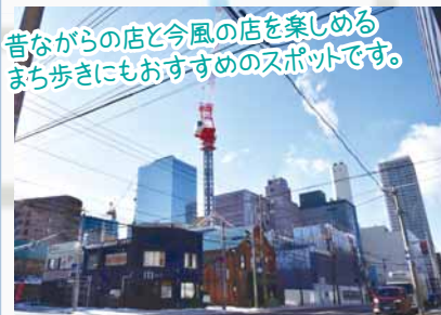
昔ながらの店と今風の店を楽しめるまち歩きにもおすすめのスポットです。