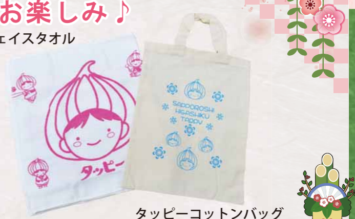
タッピーコットンバッグ