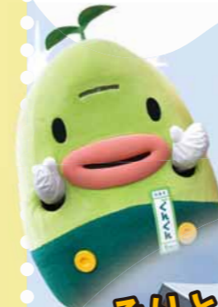
◀さとらんどイメージキャラクター「ぐんぐん」