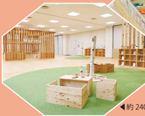
▲おままごとコーナー