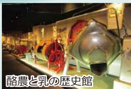
酪農と乳の歴史館