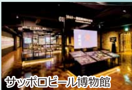
サッポロビール博物館