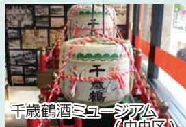
千歳鶴酒ミュージアム (中央区)