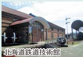
北海道鉄道技術館