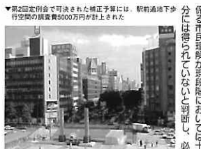
▼第2回定例会で可決された修正予算には、駅前通地下歩行空間の構築費6000万円が計上された。

駅前通地下歩行空間は、大通駅、市立病院、市役所、本館の4つの駅を結ぶ地下通路を計画している。