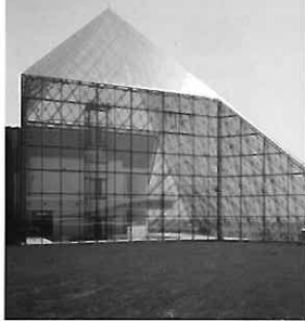
※1 本館1階は、市民活動支援センターとして活用される。2階は、市民活動支援センターとして活用される。3階は、市民活動支援センターとして活用される。