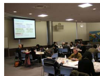
モニター連絡会議の様子