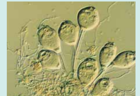
下水をきれいにする微小な生物

水再生プラザでは、水より重い汚れを除去する「最初沈殿池」、活性汚泥の中にある微小な生物の働きによって下水を生物処理する「反応タンク」、水と汚泥を分離する「最終沈殿池」などの施設を運転管理して、下水をきれいにして河川に放流しています。