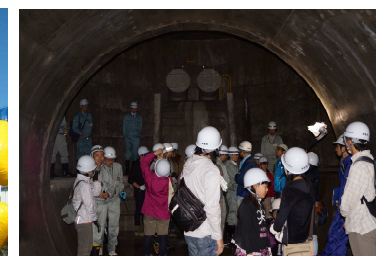
豊平川雨水貯留管見学会