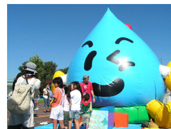
下水道科学館フェスタ