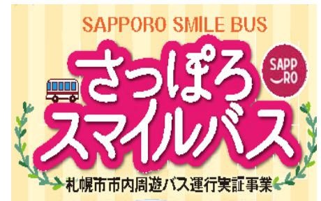
▲「さっぽろスマイルバス」ロゴ

外国語 (英語、中国語 (繁体字・簡体字)、韓国語) に対応したリーフレットを作成。留学生など英語対応が可能なスタッフが乗車し、乗車券の販売や問い合わせに対応。