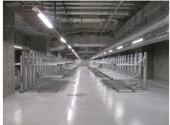
▲駐輪場内部の様子