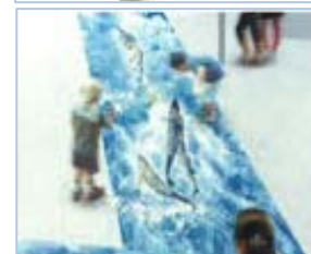
▲飛び出す映像体験