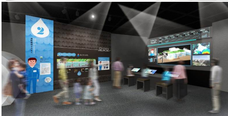
▲水再生プラザ運転シミュレーション