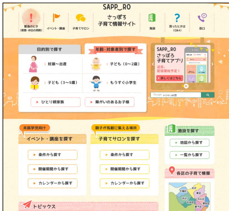
▲ウェブサイトイメージ