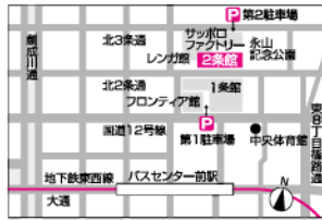
サッポロファクトリー第1～第4駐車場は1時間無料です。(第2駐車場のご利用は午前10時からとなります。)

・「サッポロファクトリー」(中央バス・JRバス)下車 ・「サッポロファクトリー前」(中央バス)下車