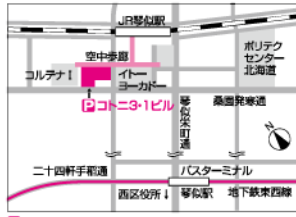
特約駐車場:コトニ3-1ビル駐車場