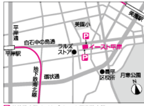
特約駐車場:タイムズイースト平岸駐車場

・南北線平岸駅 3番出口より東へ約750m ・平岸5条8丁目(中央バス)下車 東へ約100m