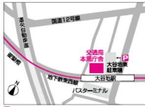
特約駐車場:大谷地東駐車場

(南郷通をはさんで/スターミナル向かい) ・「大谷地ターミナル」(JRバス)下車 ・「大谷地駅」(スターミナル) (中央バス)下車