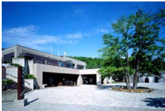
芸術の森センター 1階 “野外美術館入口” 2階 “レストラン芸術の森”