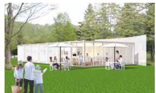
サマーフォレスト・レストラン 完成予想図