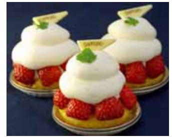
さっぽろ・いちごタルト