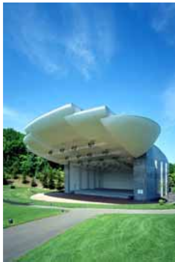
野外コンサート会場 芸術の森野外ステージ