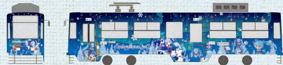
illustration by comet / 雪ミク2017 © Crypton Future Media, INC. www.piapro.net piapro