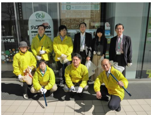
北 2 条西 1 丁目区域 集合写真