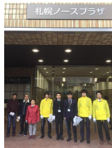
北 1 条西 4 丁目区域 集合写真