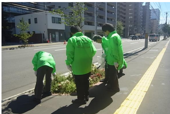
道路清掃活動状況（北1条東2）