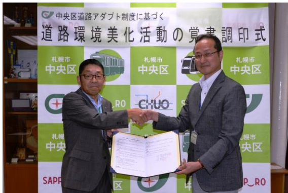
平成28年8月29日覚書調印式