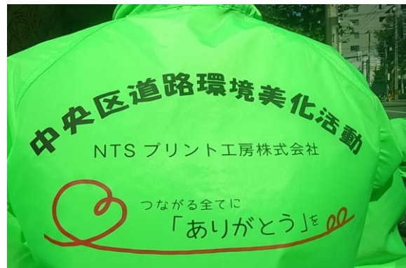
活動用ジャンパー