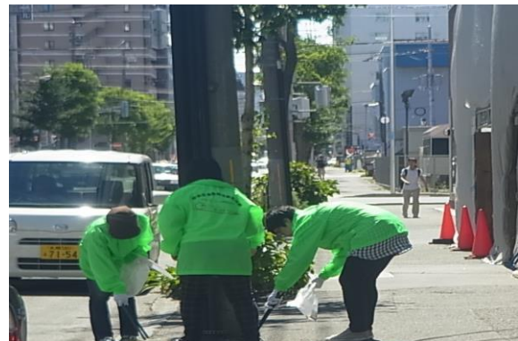
道路清掃活動状況（北1条東1）