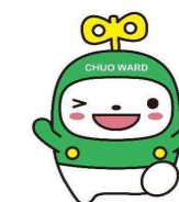
中央区マスコットキャラクター「中ウォークン」