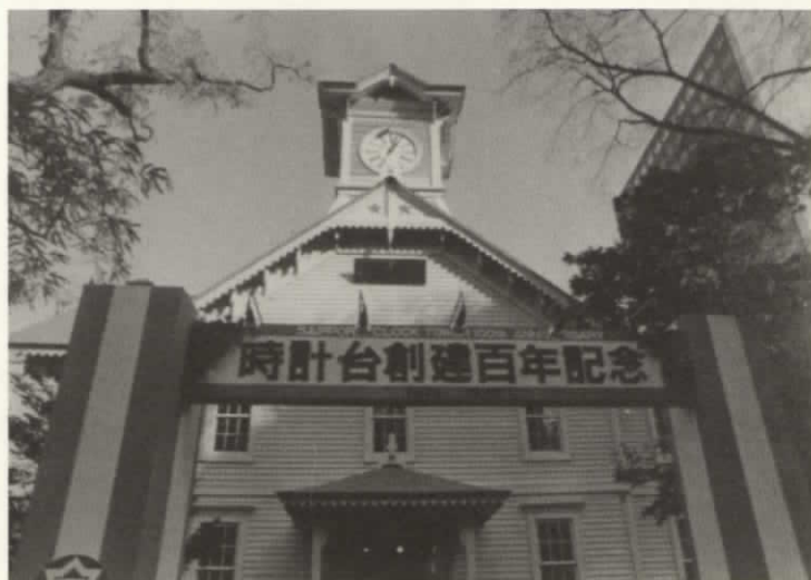
創建百周年を迎えた時計台（昭和53年）

込むところを見たい」と頼み込み、鐘の原料となるスズや鉛が真っ赤に溶けているつぼの前に案内してもらいました。そして、「この鐘が、札幌の人々の心を温め、励ます鐘になりますように」と祈りを込め、