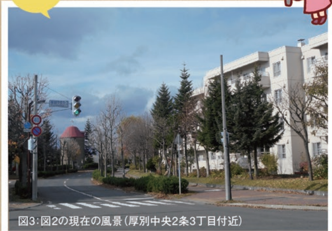
図3: 図2の現在の風景(厚別中央2条3丁目付近)