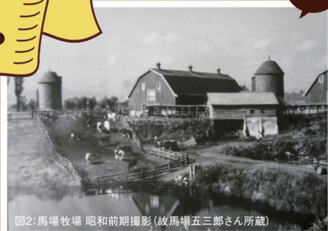
図2: 馬場牧場 昭和前期撮影