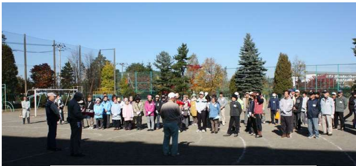
訓練当日、自治会やまちづくり団体などの約100人が参加しました。

次は、開催場所の検討です。始めは大人数を集められる広さ、トイレと水が確保できる場所として公園での検討を進めましたが、雨天時の対応が難しいことから、今年から地域との交流事業を進めているもみじの森小学校に相談したところ、グラウンドと体育館の使用を快く承諾していただきました。