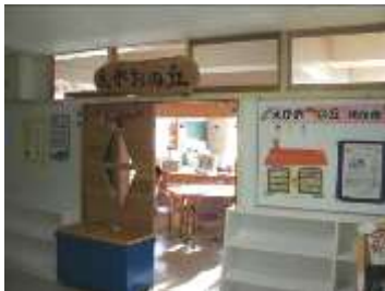
明るい図書館入口

みずほ小学校時代の昭和53年に札幌市で初めての開放図書館「みずほの森」として開館し、平成23年の小学校の統合によりもみじの丘小学校になったことから「えがおの丘」図書館として再出発した、34年の歴史をもつ開放図書館です。蔵書数は約12,000冊で一般書は約3,000冊あり、最近のベストセラーなども揃っています。