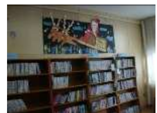
クリスマスの飾付

図書館では、子どもたちと地域の方々に長く愛され、利用していただける図書館になるよう取り組んでいます。