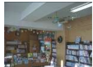
ボランティアさんによる飾付