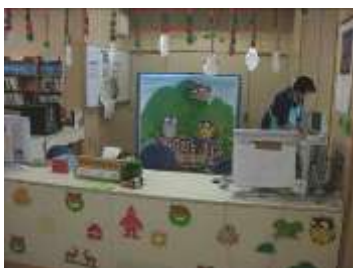
森の図書館のキャラクター

もみじの森小学校の「森の図書館」は平成24年5月8日に開館した新しい開放図書館です。蔵書数は約9,400冊で一般書は約830冊揃っています。