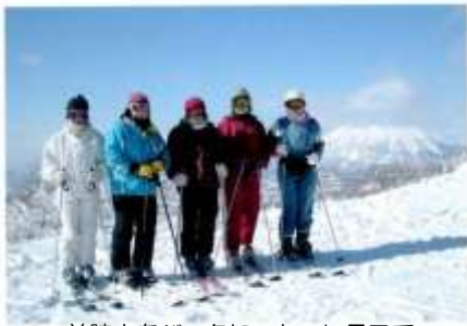
羊蹄山をバックにニセコヒラフで

もみじ台スキークラブは34年前（昭和53年）に、もみじ台婦人部スキー同好会として女性のみで40人前後で発足しました。その後、昭和57年には現在の「もみじ台スキークラブ」の名称になりましたが、当時はまだ女性のみで構成されていたとのことです。