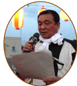
進行：森重自治連副会長