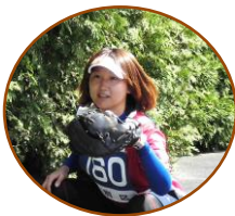
チームの華・腕前も本物 梅内姉妹