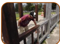
まるで職人さんのような刷毛さばき ヘルメット姿も様になっています。

皆さんも、汗を流してくれた方々に感謝をしながら、「もみじ台の宝」とも言える熊の沢公園の眺望を存分に味わってくださいね。