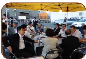
お越しいただいたご来賓の皆さまもおまつり気分談笑