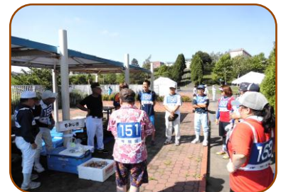
試合前のミーティング チームメイトの心は一つに！