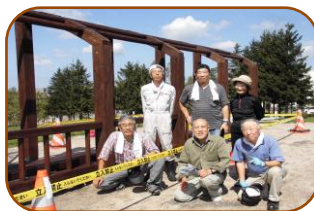
作業を終えて 満足気な皆さん