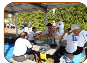
ここでも 自治連役員の 皆さんが しっかりサポート