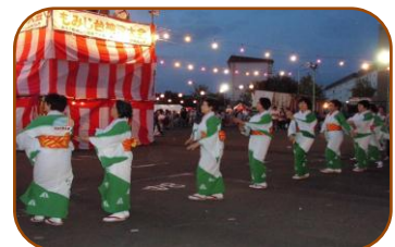
自治連女性部の皆さんの“舞”