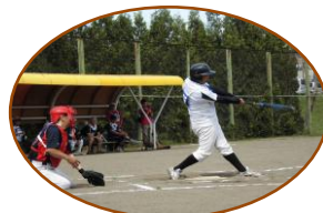
漁濱選手は特大アーチ