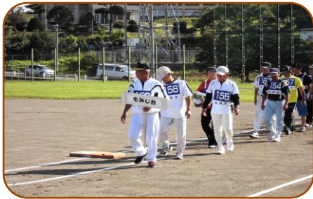
もみじ台の精鋭たち！ 力強い？入場行進

今年で25回目を数える「厚別区民地区対抗ソフトボール大会」が、去る8月17日（日）、もみじ台東側緑地野球場で開催されました。