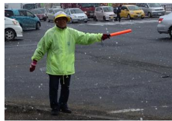
4月12日 ▲ (雪)