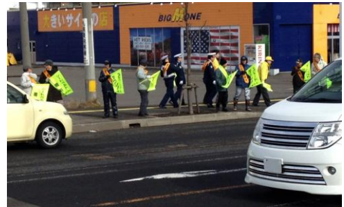
4月8日 ▲ (強風)