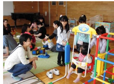
4月の「ぴーちくパーク」の様子