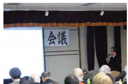
青葉の現状と課題