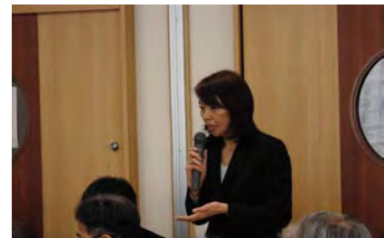
地域支援事業の説明