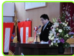
もみじの丘小 石澤校長先生