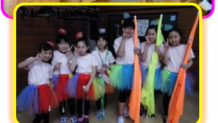
将来のカラーガード隊?! 児童会館の皆さんも 日頃の成果を披露しましたヨ