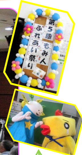
会場を盛り上げてくれた 厚別区のピカットくと 江別市のえべチュン 珍しいツーショット★

平成27年3月22日(日)、もみじ台管理センターで「もみ人ふれあい祭り」が開催されました。このイベントは、もみじ台管理センターを管理運営する日興美装興業(株)さんが主催し、もみじ台地域の方々が力を合わせて運営しているものです。