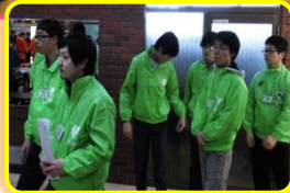
北星学園大学(上)や 星槎学園(下)の生徒さんも それぞれの役割を立派に 果たしてくれました!