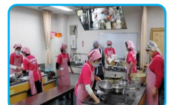
もみじ台のイベントには 食生活改善(委)の皆さんの お力添えが欠かせません いつもありがとうございます!