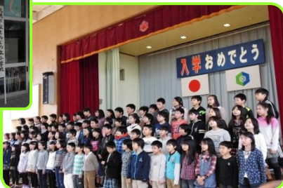
上級生からの歓迎セレモニー み～んな いい顔しています