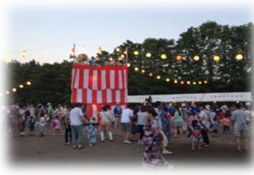
上野幌中央協議会夏祭り