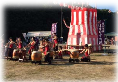
ふるさと創成夏祭り