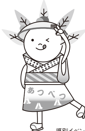
厚別イベントキャラクター「ピカットくん」