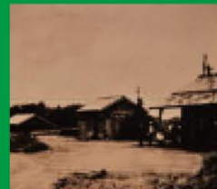
▲昭和初期の上野幌駅

1973年、千歳線が新札幌駅を通る路線に変わったため、それまであった東札幌駅、月寒駅、大谷地駅、上野幌駅の4駅がなくなりました。上野幌駅は、東へ移りましたが、1991年、その跡地に厚別南公園ができました。駅舎が置かれていた小高い丘の上には、駅のシンボルだったイチイの木が今も残り、美しい花や緑に囲まれていた当時の様子が感じられます。サイクリングの途中に公園で休憩したり、テニスコート、自転車広場で遊ぶこともできます。