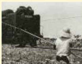
▲D51型蒸気機関車。現在の地下鉄大谷駅付近