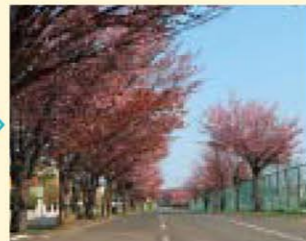
▲いまの陽だまりロード