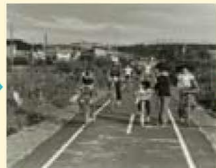
▲できた当時の陽だまりロード