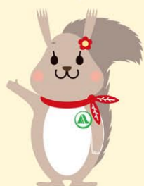
▼しらかばトンネルのモザイクタイルアート