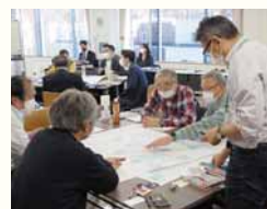
きよた暮らしラボの様子

区民センターの整備に当たり大事にしたい考え方やどのような使い方をしたいか、どんな空間であってほしいかなどについて話し合うワークショップを開催します。令和5年11月から令和6年6月まで4回程度、きよたまちづくり区民会議、区内の企業や学生、公募の区民など、30人程度の規模で意見交換を行います。