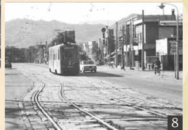
写真1～8: 札幌市公文書館所蔵。