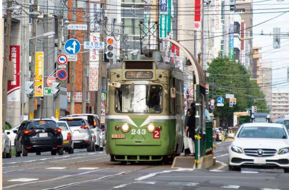
令和5年9月、往年のツートンカラーをまとう243号車と西8丁目電停(南1西7)。