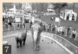
7 / 昭和47年の丸山動物園(宮ヶ丘3)。8 / 昭和44年の電車通(南1西18)。