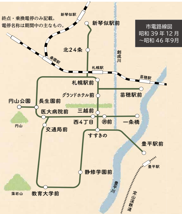
札幌市『市電物語(さっぽろ文庫22)』(昭和57年)所収の講神清編「電車路線変遷図」および札幌市交通局『札幌市交通事業小史 昭和32年8月から昭和42年12月まで』(昭和43年)所収の「電車運転系統図」を参考に作図。