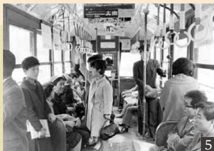
5 / 昭和40年の市電車内。中央右、手すりの奥に改札かばんを下げた車掌が立っている。6 / 昭和33年の札幌駅前通(北4西3)。