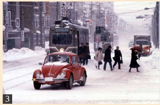
3 / 昭和57年の冬の中央区役所前電停(南1西11)。4 / 昭和45年の札幌駅前通(南2西4)。路面には地下鉄工事のため仮設の覆いが敷かれている。