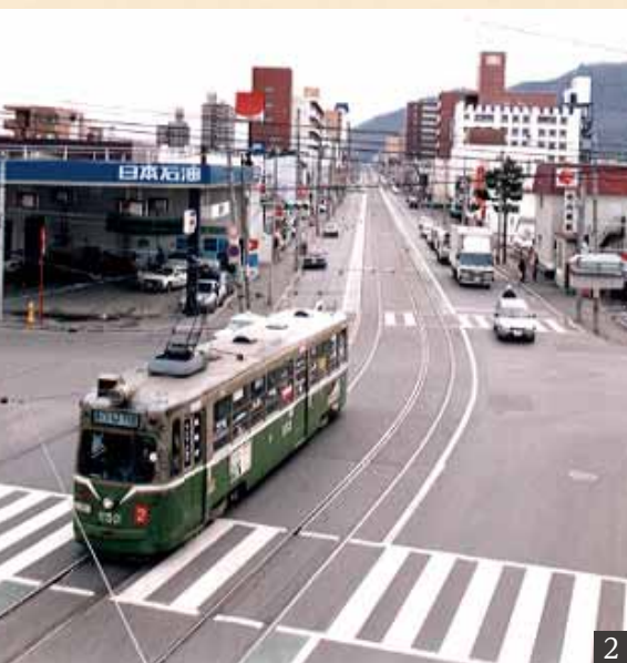
1/昭和40年、すすきのから札幌駅前通(南4西3)。下部には豊平線への分岐が見える。2/平成2年の西15丁目通(南3西14)。御幸交番前の歩道橋から。