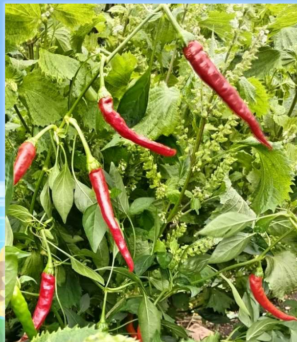
自家製堆肥でガーデニング！フォトコンテスト入賞作品 【主催：さっぽろスリムネット】