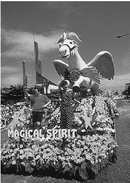
ローズフェスティバルでのパレード

また、9月～10月に行われる「ポートランドマラソン」は、ウォークからフルマラソンまでと競技内容が幅広く、多くの市民に愛されているマラソン大会だ。