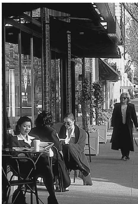
ポートランド市のショッピング街

数多くのデパート、専門店をはじめ、大規模なショッピング・モール、住宅地に隣接したショッピング・センターなど、多様な商業施設がある。また、3月からクリスマスまでの土日開催されるフリーマーケット「サタデーマーケット」はポートランドの名物。手作りのアート&クラフトを中心に多くの露店や屋台が並び、毎週末たくさんの人で賑わう。