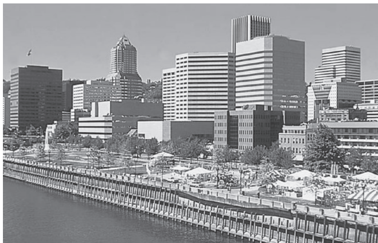
ポートランド市街地

オレゴン州最大の都市であるポートランド市は、エコロジーやリサイクルの先進都市であり、公園、自転車専用レーン、橋、自然と文化が調和する美しい環境都市として知られている。