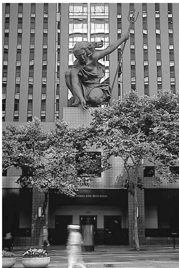
市役所新庁舎の女神像