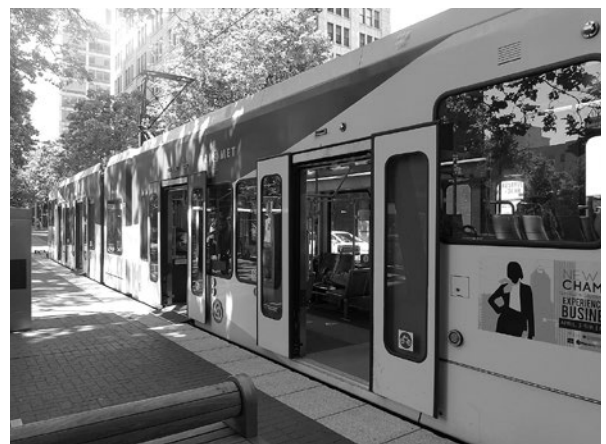
ポートランド市内を走るマックス

らポートランド南東部に位置するクラカマス・タウンセンターに向かう「グリーンライン」及び市中心街から南部のミルウォーキーに向かう「オレンジライン」の5本の路線を有している。また、同じくトライメットが運行する路線バスは、市内及びその近郊に多くの路線を有し、市民の日常の移動手段として利用されているとともに、市内の見どころにアクセスする際にも便利な乗り物である。この他にも、ポートランド市が運行する路面電車（Street Car）もあり、トライメットと同じ料金システムとなっている。