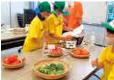
■ 施設見学ツアー(アクティビティ)