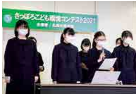
●発表の様子(令和3年度)