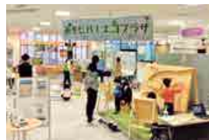
■ 環境活動団体のプログラム出展の場の提供