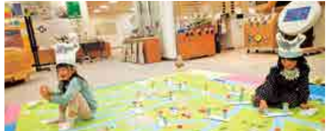
■ 子ども向けワークショップ