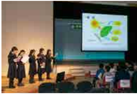
●ステージ発表(令和元年度)

令和3年度(2021年度)は新型コロナウイルス感染症対策のため、これまでのステージ発表にかえ、発表の様子を事前に収録し、令和4年1月にオンライン形式で開催した「環境広場さっぽろ」の中で、審査結果とともに発表動画を公開しました。