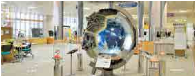
■ 環境プラザ展示コーナー

環境問題について知ることができる展示とその解説を行っているほか、環境問題につながるさまざまな事業を行っています。