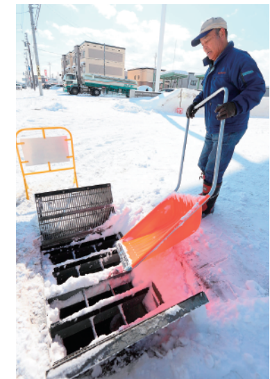
新琴似北流雪溝 投雪風景