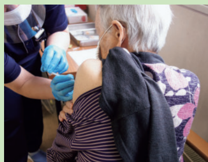
▲新型コロナウイルス感染症 のワクチン接種(令和3.5)

東京2020オリンピック・パラリンピック大会は、新型コロナウイルス感染症の感染拡大により、1年延期して開催されました。