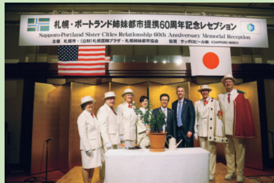
▲札幌・ポートランド姉妹都市 提携60周年記念式典・記念 レセプション(令和元.10)