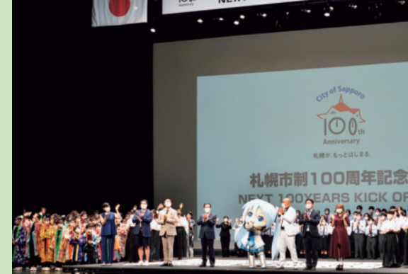
▲市制100周年記念式典(令和4.7)