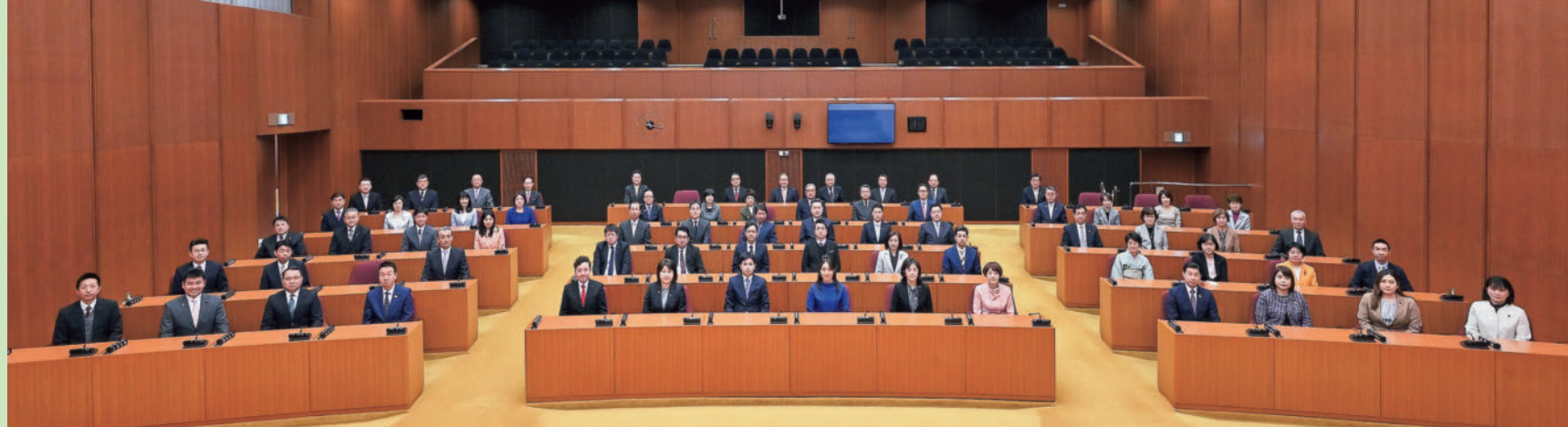
▲第25期市議会議員(令和5.1)

また、議員提案による「札幌市歯科口腔保健推進条例」の制定や、平成25年に施行した「札幌市議会基本条例」の検証の実施、24年ぶりとなった各区選出議員数の改正など、議会の機能強化・改革を進めました。