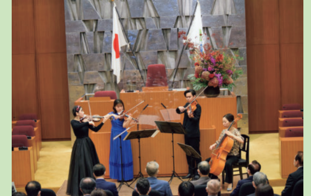
▲市議会100周年記念式典(令和4.10)

大正11年8月1日に市政が施行され、札幌はそれまでの札幌区から札幌市となり、同年10月には初の市会(後に「市議会」へ改称)が開催されました。令和4年は、市制施行・市議会開設から100周年の節目の年でした。